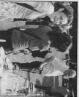
Des promeneurs heureux.

En ce dimanche 21 août, un très sympathique vide-greniers au lieu-dit "Les Planches". Il était organisé par l'Amicale des aînés de Cahau présidée par Isabelle Blais, épouse d'une quinzaine de bénévoles. Dans un